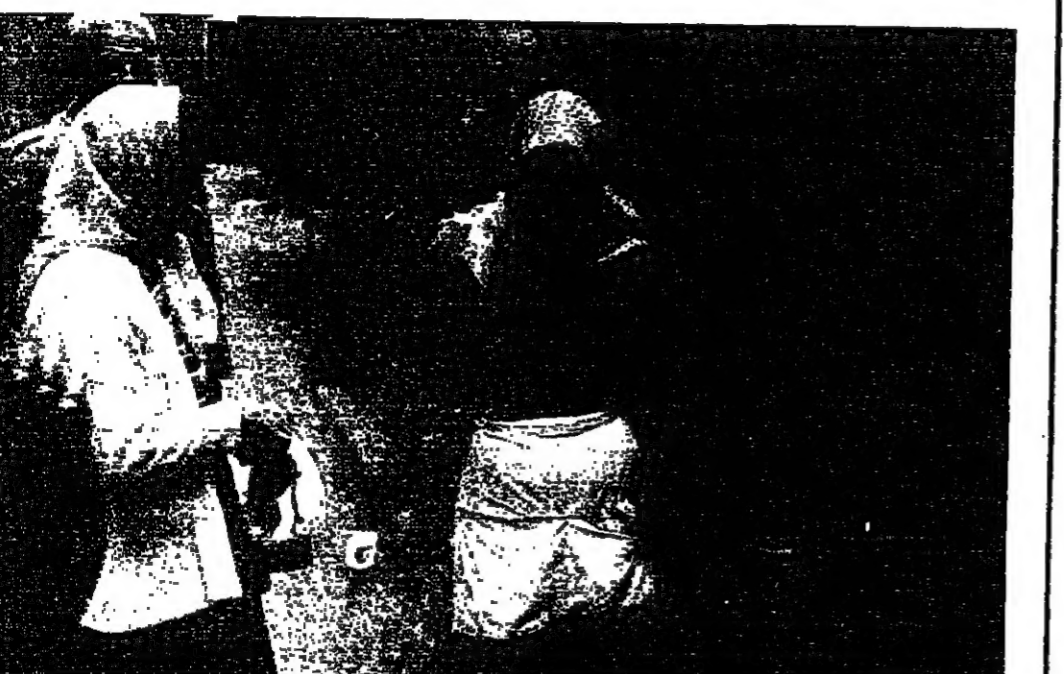
شيرة على العمل فريسة على السندان